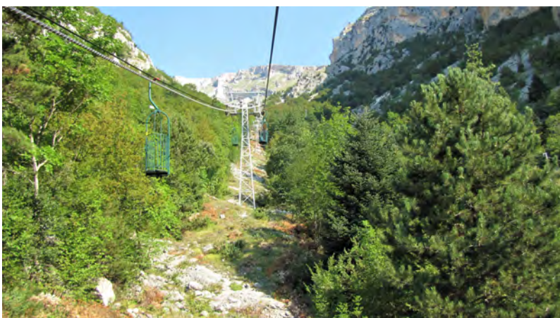
Cestovia - Grotte del Cavallone - Vallone di Taranta