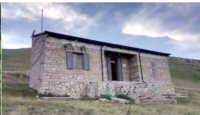
Rifugio Macchia di Taranta